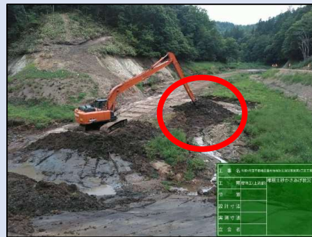
現況掘削土攪拌改良