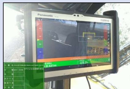
TS方式によるICT機械モニ