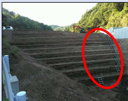
昇降機設置(手摺階段)