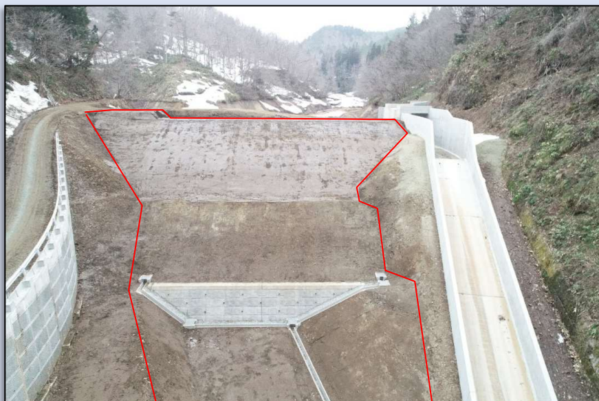
完 成 (堤体工)