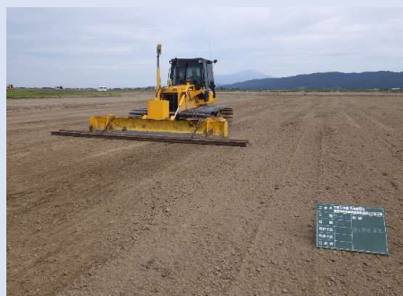
超湿地ブルによる整地